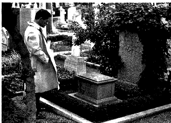
«Diversamente rossi, due gerani». Sopra un affresco a cura della casa natale Gramsci. Al centro Pier Paolo Pasolini al Cimitero acattolico. Sotto il murale in una scuola del Trullo a Roma

Dei fatti maturano nell'ombra, poche mani, non sorvegliate da nessun controllo, tessono la tela della vita collettiva, e